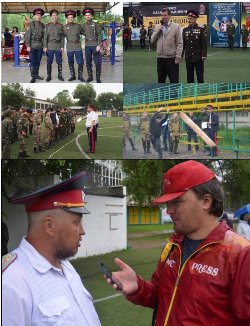
Казачьи игры в г. Кант 2018 г. при поддержке «Россотрудничества»

колонны» для продвижения и укрепления влияния российского режима в Кыргызстане.