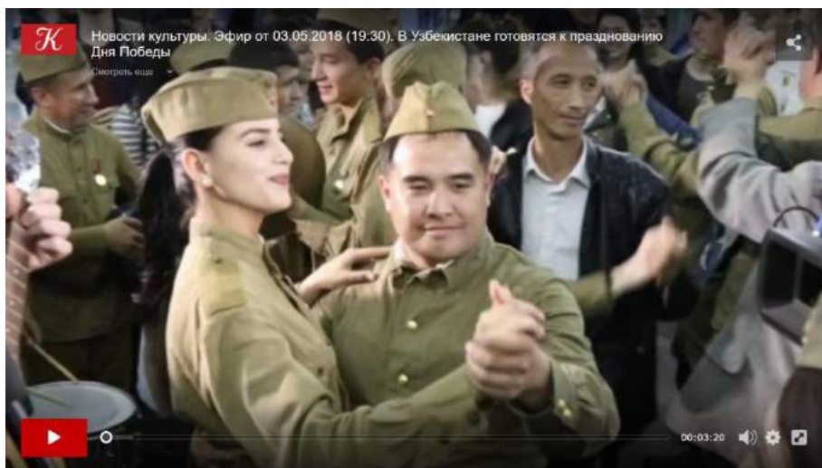
Скриншот видео из мероприятия, посвященного празднованию Дня Победы в Узбекистане

школах по различным предметам, курсы по обучению русского языка, организацию выставок, обеспечение онлайн-доступа к записям спектаклей российских театров и т.п. Такая деятельность по линии «мягкой силы» не носит откровенно идеологической направленности, но создает благоприятный фон для программ, более идеологически заряженных. В целом, военная тематика, доминирует в половине мероприятий, запланированных Центром на июнь и июль этого года: 9 из 18 и 7 из 15 соответственно (см. в приложении). Этот определенный милитаристский уклон в тематике деятельности Центра видимо сохраняется на протяжении всего года. Осветим некоторые такие программы и инициативы военно-патриотической направленности.