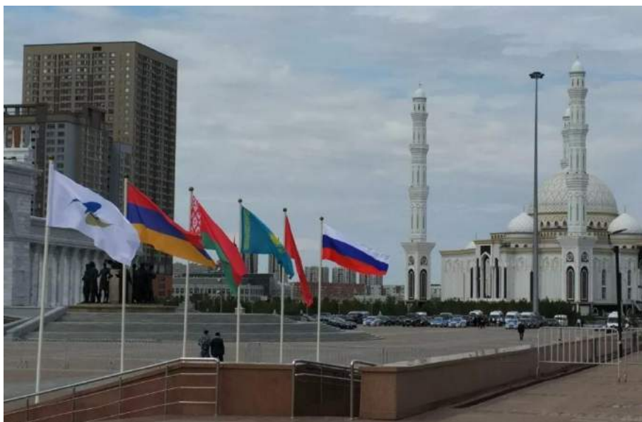
Фото флагов стран-участниц ЕАЭС в г. Нур-Султан