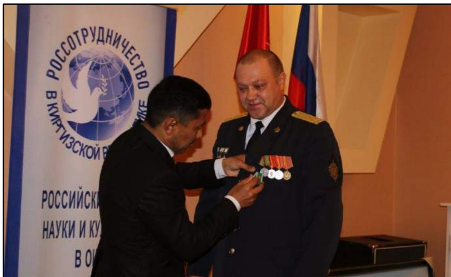
Фото с мероприятия Оперативной пограничной группы ФСБ России в Кыргызстане

В случае с же Кыргызстаном, российские спецслужбы действует более свободно и открыто. Например, в декабре 2017 года, «торжественное собрание, посвященное 25-летию со дня образования Оперативной пограничной службы ФСБ России в Киргизской Республике» 47 , прошло с участием группы важных официальных лиц России, работающих в городе Ош, включая генконсула России, директора Россотрудничества и заместителя начальника Оперативной пограничной службы ФСБ, а также представителей мэрии города Ош, пограничной службы, прокуратуры и госкомитета национальной безопасности (ГКНБ) по Ошской области.