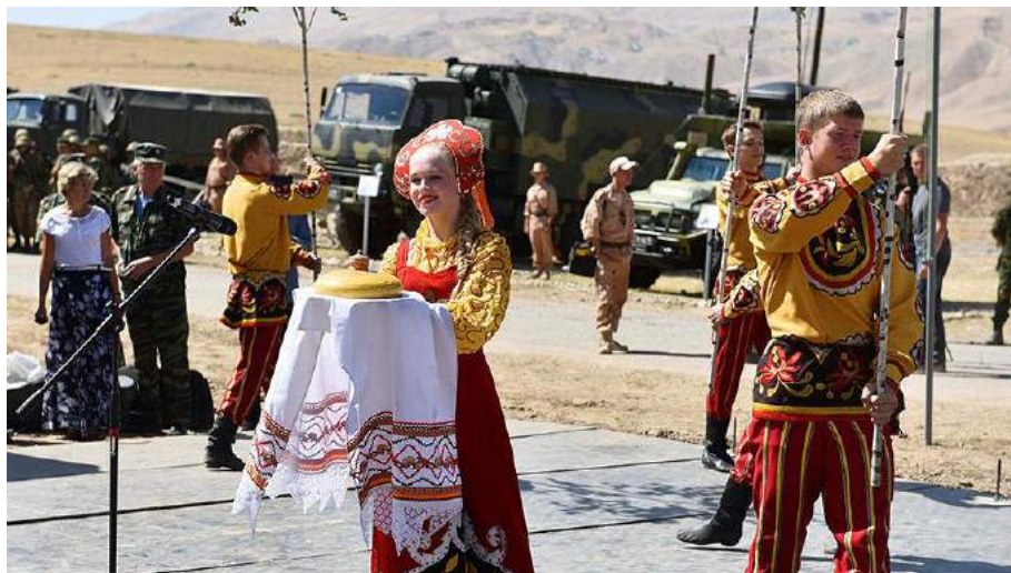
Фото с мероприятий в 201 российской военной базе в Таджикистане

Российская дипломатия и СМИ представляют РФ как исключительно положительную внешнюю силу, которая, с одной стороны, защитила Таджикистан от радикалов-исламистов, а с другой стороны, сыграла ключевую роль в организации мирного процесса и окончании гражданской войны.