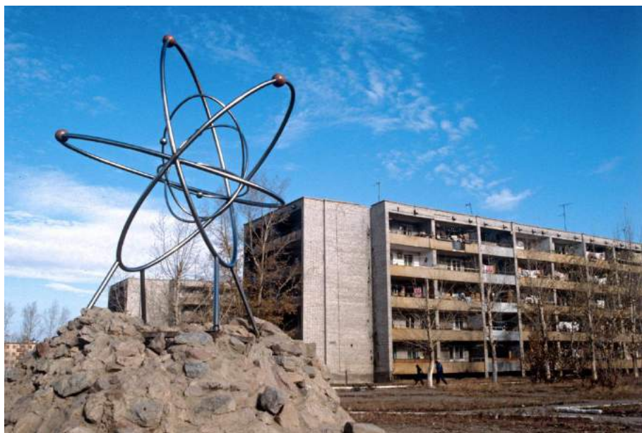
Центр Семипалатинского ядерного полигона, г. Курчатов, 1991 г.

Таким образом, на деле всячески тормозится диверсификация и развитие индустриально-технологического потенциала суверенного Казахстана. Особую лепту в данный процесс вносит контролируемая «утечка мозгов» из Казахстана в Россию через разнообразные образовательные и научные программы сотрудничества , которые представляются на информационном поле как «исключительное благодеяние» со стороны соседнего, дружественного государства. Тогда как, на практике талантливая молодежь, вследствие полученного образования, работы в дальнейшем пополняют трудовые и человеческие ресурсы Российской Федерации, и ее интеллектуальный потенциал.