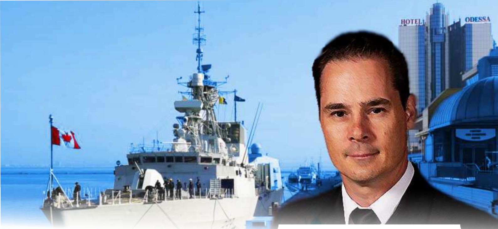
Канадський фрегат «Торонто» в порту Одеси