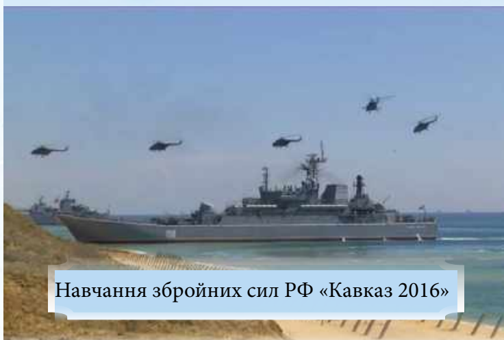
Навчання збройних сил РФ «Кавказ 2016»

Угруповання малих ракетних та патрульних кораблів та катерів ЧФ РФ є оптимальним з точки зору застосування в Чорному та Азовському морях.