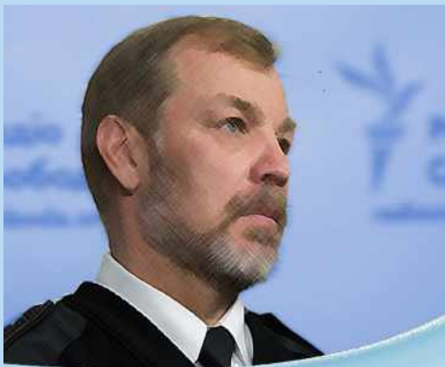
Сергій Гайдук, віце-адмірал, командувач ВМС України (2014-2016), Голова Асоціації ветеранів ВМС

Про зовнішні загрози говорять давно і багато. Це, безумовно, виклики світовому порядку, які характеризуються агресивними діями Росії на Чорному та Азовському морях не лише відносно України, але й країн НАТО. Чорноморський флот РФ – це потужний інструмент реалізації зовнішньої політики Кремля.