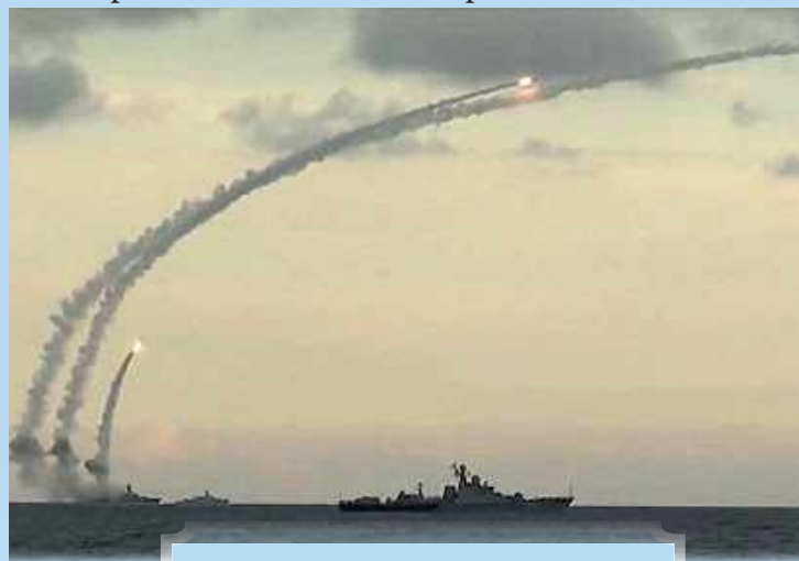
Пуски крилатих ракет «Калібр»

За інформацією з відкритих джерел, Росія буде продовжувати посилювати військову напруженість в Чорному та Азовському морях. Апогеєм цих зусиль у 2020 році стануть стратегічні навчання «Кавказ-2020», заплановані на вересень цього року. «Кавказ-2020» відбудеться на південному стратегічному фланзі ЗС РФ, включаючи окупований Крим та акваторію Чорного та Азовського морів.