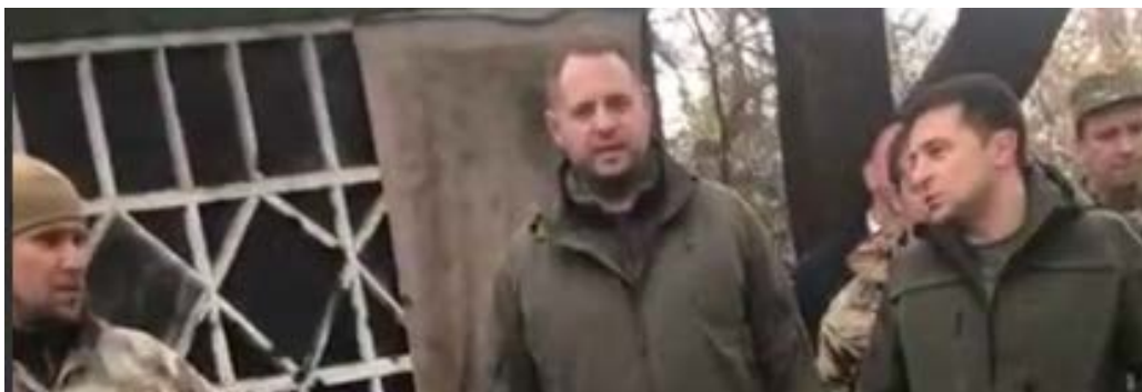
Валентин Бадрак, директор Центру досліджень армії, конверсії та роззброєння (ЦДАКР)

Ключовим країнам Європи «замирення» України з Росією будь-якою ціною більш важливе, ніж реальні інтереси України